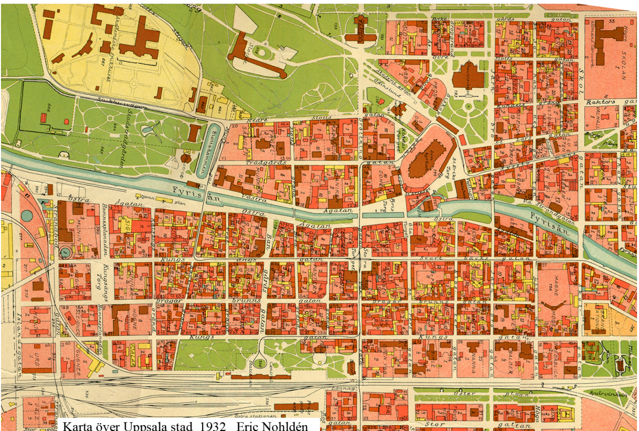
Karta över Uppsala stad 1932 Eric Nohldén